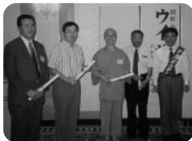
テールツイスターより 誕生日の新聞を贈呈