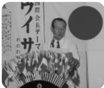
副テールツイスターの時間？ 7月第1例会（H13.7.5）