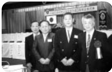
川之江LC40周年記念事業式典に参加 川之江文化センター (H14.2.17)