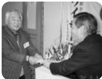
例会連続純出席表彰 (H14.3.7)