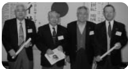
誕生日の新聞を贈呈 2月第2例会 (H14.2.21)