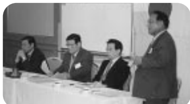
30周年記念事業 パネルディスカッション 2月第2例会 (H14.2.21)