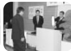
今治工業高校校定時制卒業式 (H14.3.1)