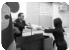
今治西高等学校校定時制卒業式 (H14.3.1)