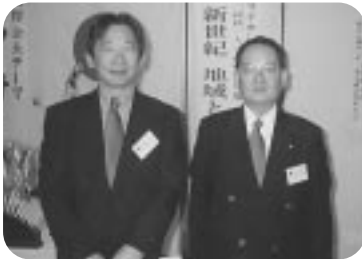
誕生日の新聞を贈呈 4月第1例会 (H14.4.4)