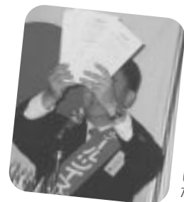
こんなにいただきました