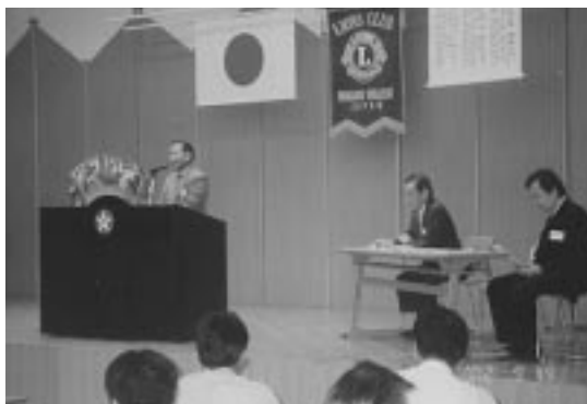
日本食研株 本社にて