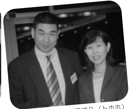
僕はもっと楽しいです? (トホホ)