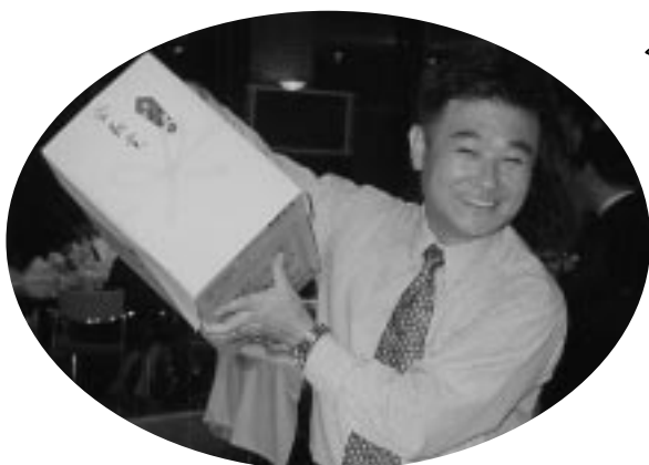
会長賞が当たりました もちろんドネーションだよ