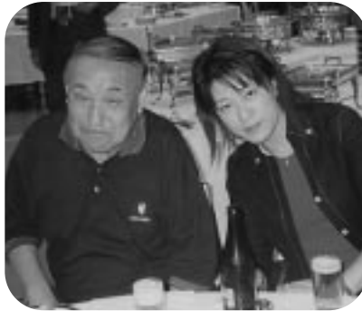
ワシやって楽しいわい