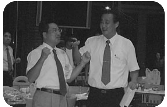
若獅子のライオンズローア