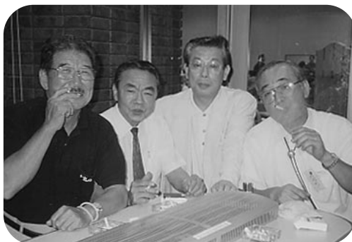
喫煙室にて… 悲しきホテル族