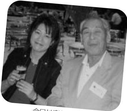
今日は楽しいです