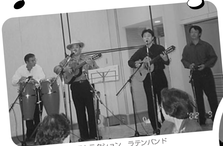
アトラクション ラテンバンド