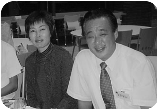
久しぶりの2人のスナップ