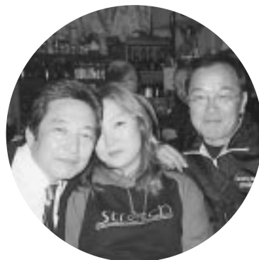
打ち上げ楽しいな!