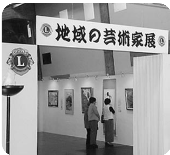
くるしまライオンズクラブ10周年記念 地域の芸術家展