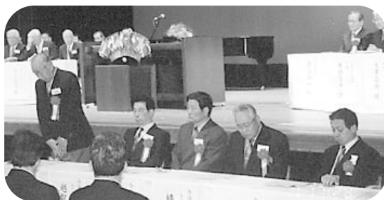
くるしまライオンズクラブ10周年記念式典 エクステンション委員のメンバー