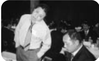
何があったんですか!?