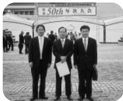
336複合地区年次大会(尾道) 次期三役(5月23日)