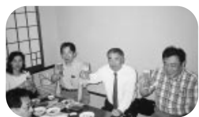
新旧理事会懇親会