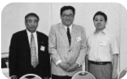
旧三役さん、お疲れ様でした