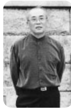
地区環境保全 保健福祉委員

じめ会員の皆様に御指導いただきながら、1年間ご迷惑をおかけすることのないよう頑張りたいと思いますので、どうかよろしく願いたします。