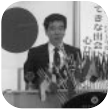
Cutter大会中止のお知らせ