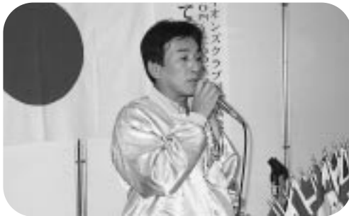
「YE」について／長野隆一 (H16.11.4)