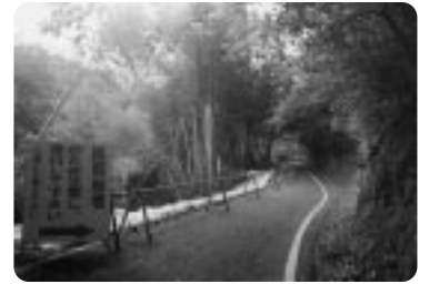
ここまで復旧しました