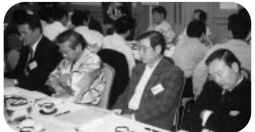
皆さん、真剣に考え込んでいます… (?)