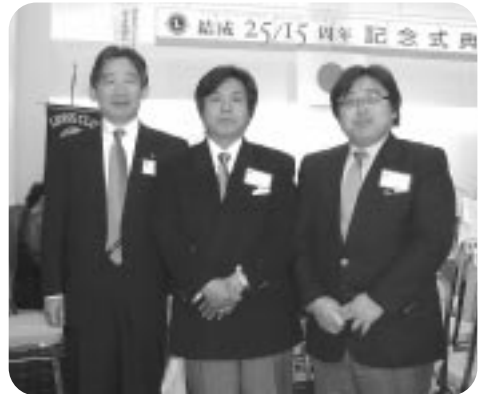
伊予三島法皇LC25周年・川之江LC15周年 結成合同記念大会に参加 (H17.3.10) 〈四国中央市ホテルグランフォーレ〉