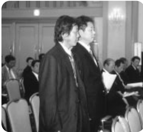
2Z 合同例会 新会員紹介 (H17.3.12)