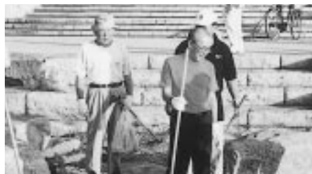
織田ヶ浜の早朝清掃