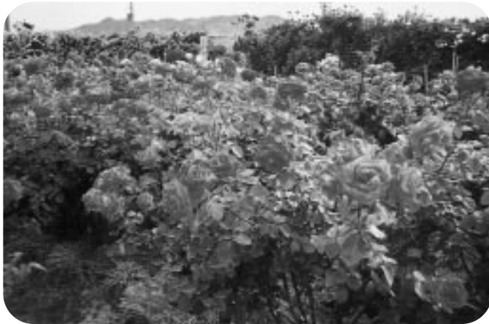
薔薇 (吉海町・バラ公園)