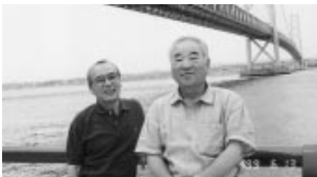
同級生の旅行 大鳴門橋