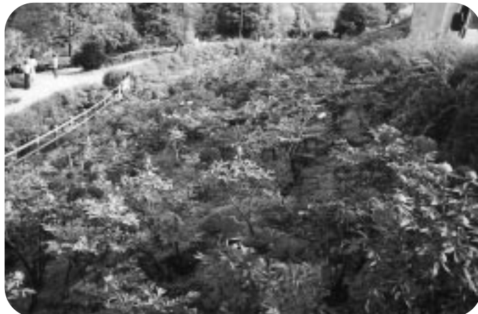
牡丹 (市民の森・フラワーパーク)