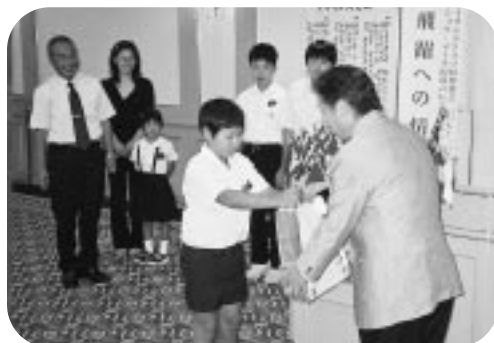
愛・地球博ライオンズクラブ子ども万博デーに招待したあすなる学園の子どもたちのお礼 8月第2例会 (H17.8.18)