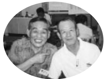
いもたき家族例会 (H17.9.15)