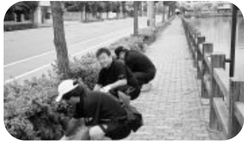
2Z合同アクト 早朝清掃 (H17.8.28)