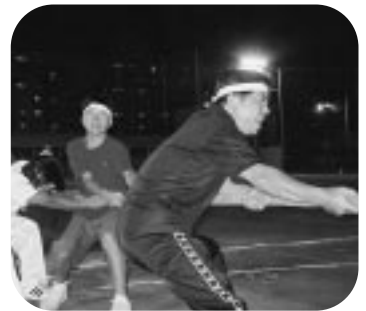
今治西高定時制秋季大運動会 (H17.9.29)