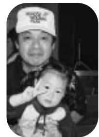
ハルモニアフェスティバル (H17.11.6)