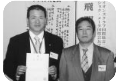
複合地区IT専門委員任命状伝達 (H17.11.17)