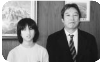
国際平和ポスターコンテスト 今治東LC賞贈呈 (H17.11.10)