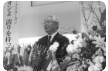
伊予土居LC30周年記念式典 (H18.3.26)