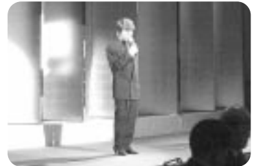
新居浜ひうちLC結成10周年記念大会 (H18.3.19)