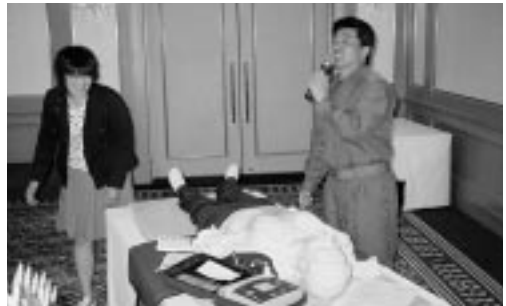
ゲスト卓話「AED」について