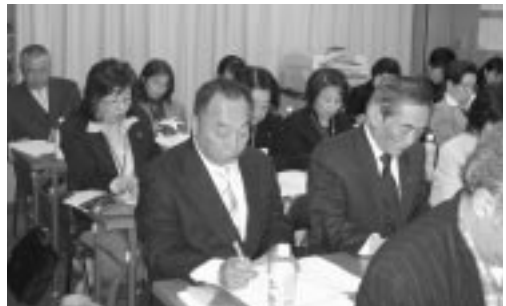
新入会員スクール