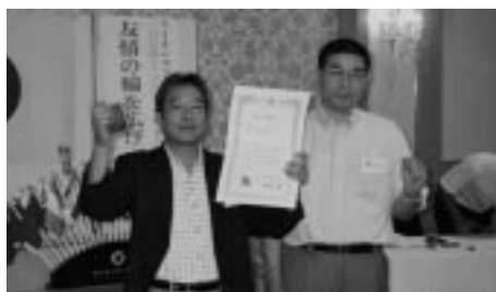
プラスワン表彰状・メダル贈呈(H18.8.3 8月第一例会)