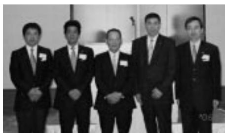
2Z地区ガバナー諮問委員会・ゾーンレベル会員委員会(H18.7.22 ケーオーホテル)