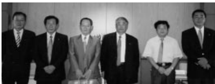
クラブ役員・委員長スクール(H18.7.15 西条ひうち会館)