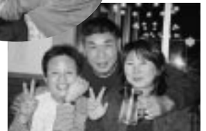
2R親善スポーツ大会 (H18.11.18)