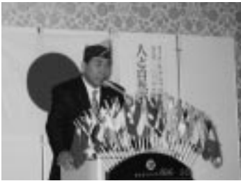
800回記念例会 会長挨拶 (H18.10.19 / 10月第2例会)