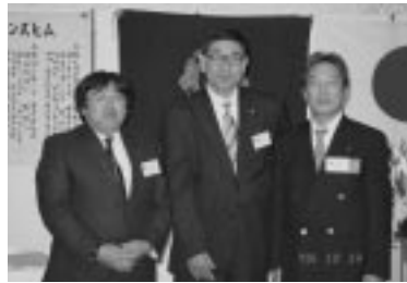
クラブ会長優秀賞並びに100%幹事アワード贈呈 (H18.10.19 / 10月第2例会)