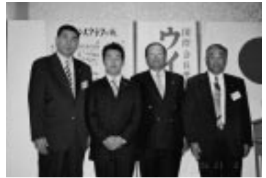
入会式 (H18.11.2 / 11月第1例会)