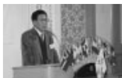
2R親善スポーツ大会 優勝報告 (H18.12.7/12月第1例会)