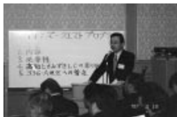
2R-2Z第35回合同例会 (H19.2.10/2月第1例会)