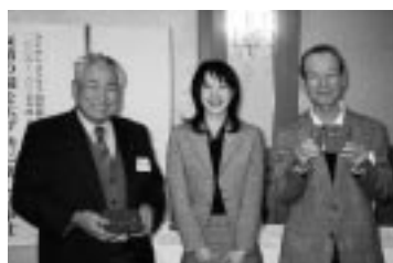
出席ラッキー賞 (H19.2.15/2月第2例会)