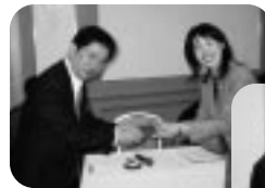
出席ラッキー賞 (H19.2.15/2月第2例会)