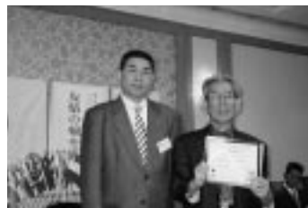
グループ・コーディネーター・アワード表彰 (H19.4.5/4月第1例会)