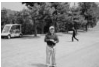
5クラブゴルフ親善コンペ (H19.3.25)