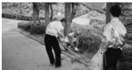
早朝清掃例会(H19.5.2/5月第1例会)