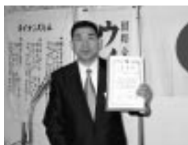
例会出席優秀賞 銅賞 (H19.5.17/5月第2例会)