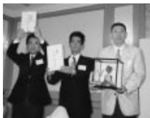
お疲れ様でした 旧三役・ZCP (H19.7.5/7月第1例会)