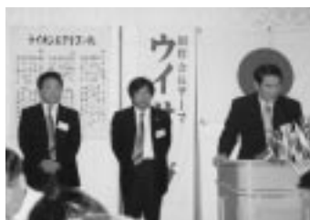
新三役挨拶 (H19.7.5/7月第1例会)