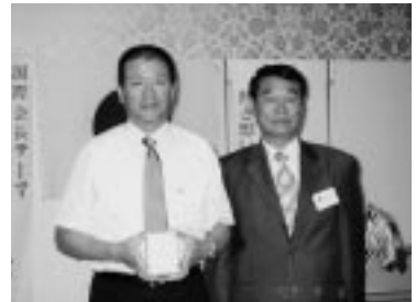
前地区役員記念品贈呈 (H19.9.6/9月第1例会)