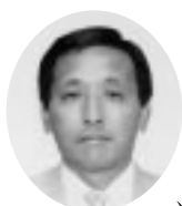
35周年実行委員会委員長

皆様方も一度しか体験することがないこの機会を、悔いなきよう、一緒に苦しみ、一緒に楽しむべく、ご協力を、そしてご指導をお願い申し上げます。