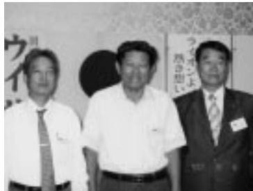
会長キー賞 (H19.9.6/9月第1例会)