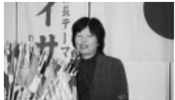
ゲスト卓話(H19.10.18/10月第2例会)