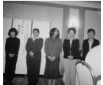
サーチングLC例会訪問 (H19.11.15 / 11月第2例会)