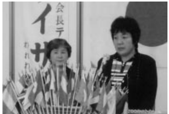
バタバタ作業所 (H19.12.6/12月第1例会)