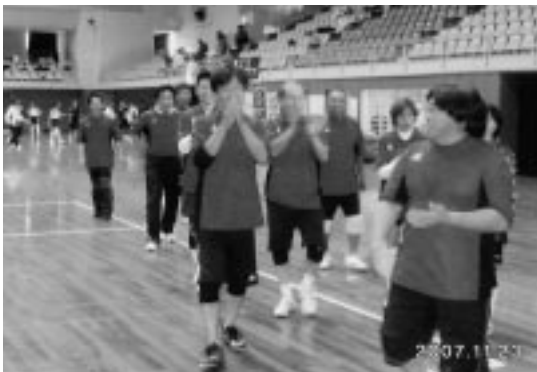
2R親善スポーツ大会 (H19.11.23)