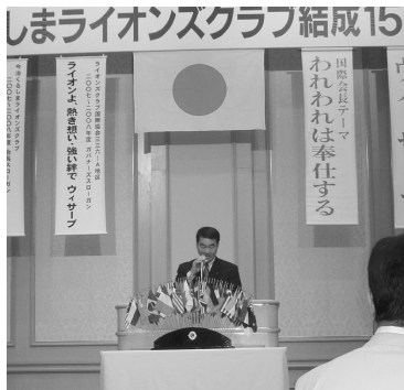
今治くるしまLC15周年記念例会(H20.4.18)