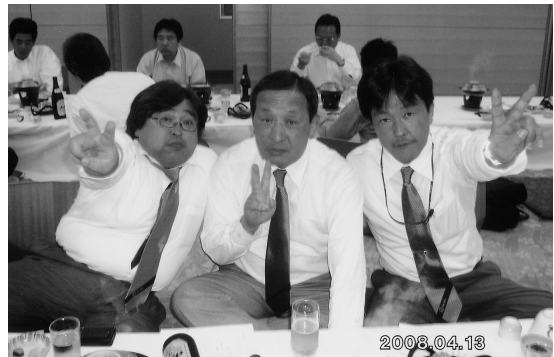
第54回地区年次大会(H20.4.13)