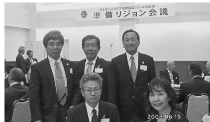
準備リジョン会議 (H20.6.15)