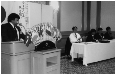
国際ホテルで今期最後の例会五役の皆さんお疲れ様でした (H20.6.5/6月第1例会)