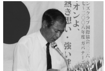
ゲスト卓話 今治養護学校/松坂先生 (H20.6.5/6月第1例会)