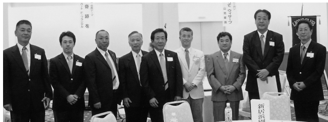
次期クラブ委員長スクール(H20.6.21)