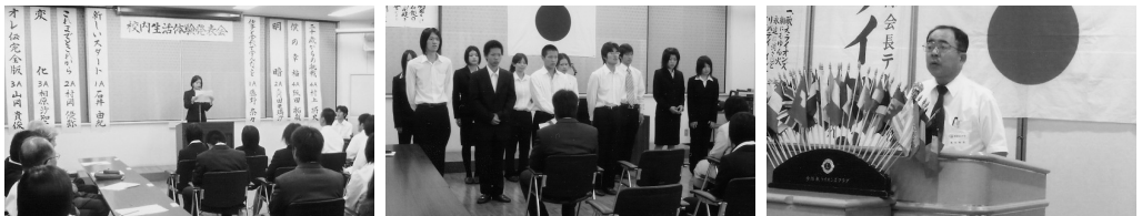
西高定時制生活体験発表会 (H20.7.17)