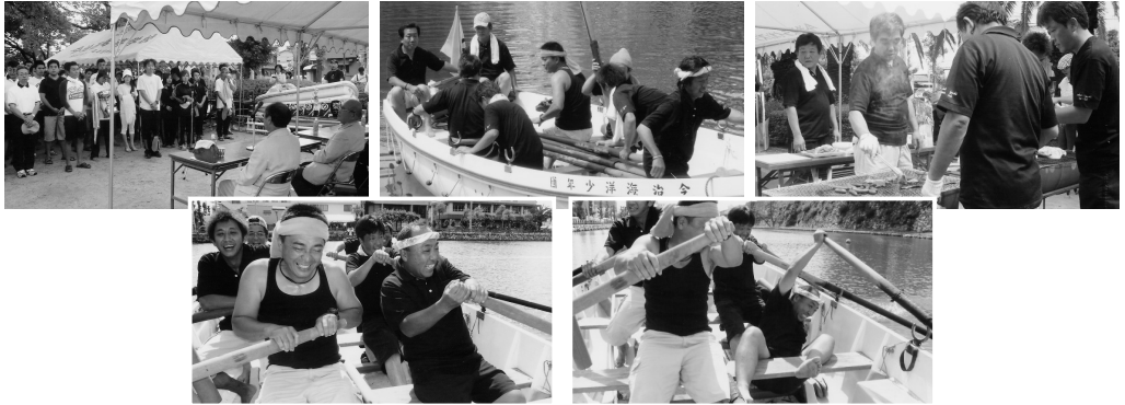
市民カッター大会 (H20.8.24)