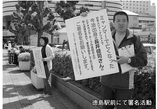
徳島駅前にて署名活動

て励ましてくれました。声を嗄らして訴えながら、深く頭を下げ、涙を流しながら心から署名をお願いしなければ誰一人として立ち止まってくれません。