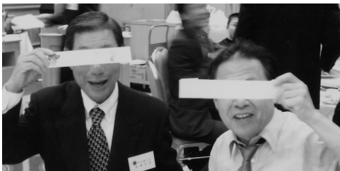
指名手配 (H21.1.4/1月第1例会)