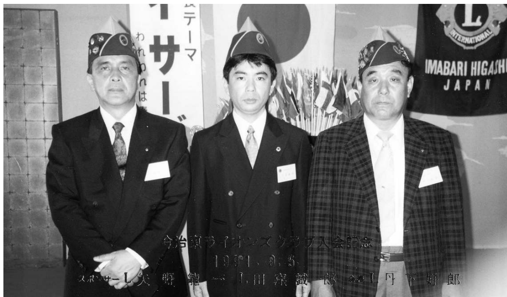
今治東ライオンズクラブ入会記念