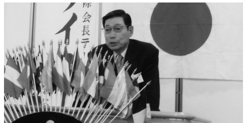
メンバー卓話 (H21.1.15/1月第2例会)