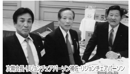
次期会長/リジョンチェアマン補佐/リジョンチェアマン