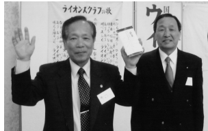
連続例会出席表彰 (H21.3.5/3月第1例会)