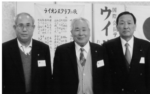
マイルストーン・シェブロン贈呈 (H21.3.5/3月第1例会)