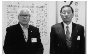
終身会員表彰 (H21.3.5/3月第1例会)