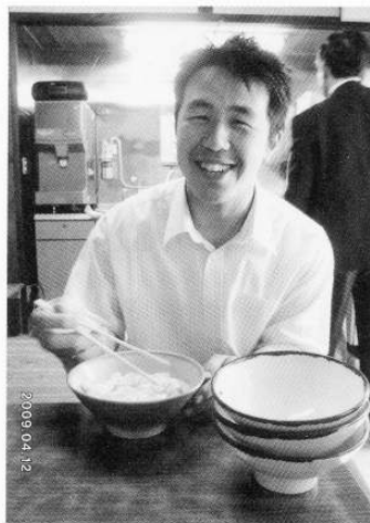
年次大会前に讃岐うどんを堪能 (H21.4.12)