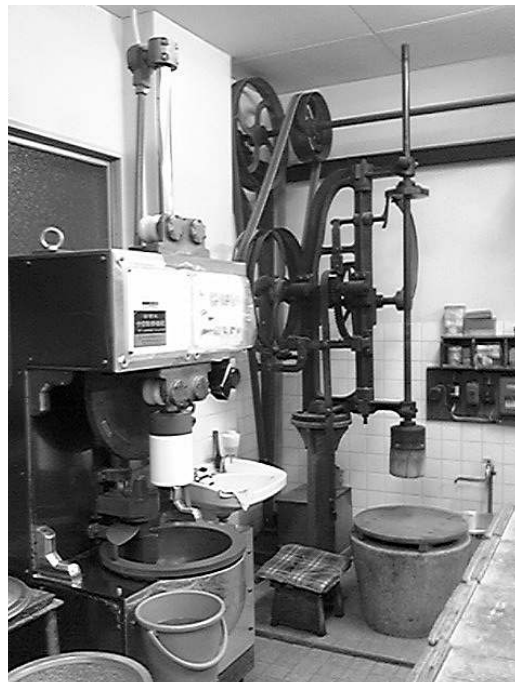
大正時代から活躍している自動落下式の餅搗機と昭和54年から使っている全自動餅搗機です。両方もエースです。