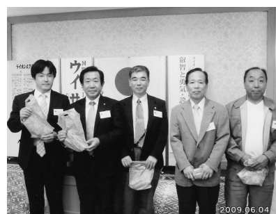
出席ラッキー賞 (H21.6.4/6月第1例会)