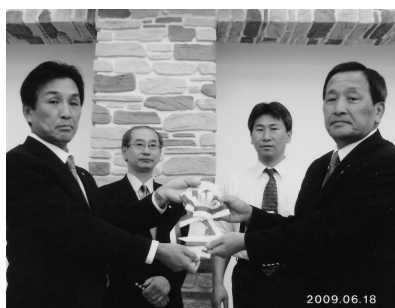
ライオンズキー引継式 (H21.6.18/最終例会)