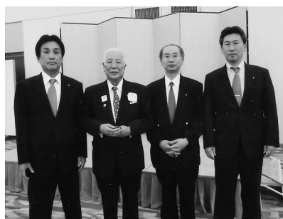
徳島にて三役スクールの後武久地区ガバナーと (H21.6.7)