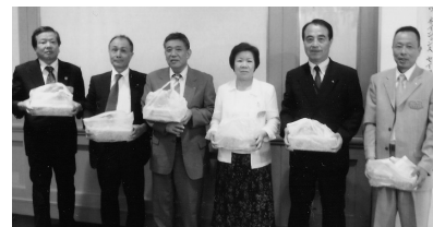
100%出席例会 来賓出席ラッキー賞 (H21.7.16/7月第2例会)