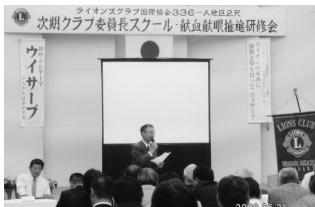
委員長スクールでの全体会 (H21.6.7)