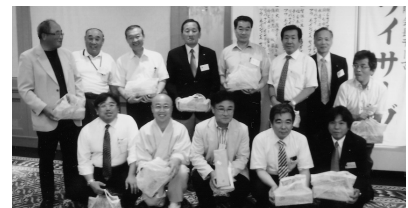
100%出席例会 出席ラッキー賞 (H21.7.16/7月第2例会)