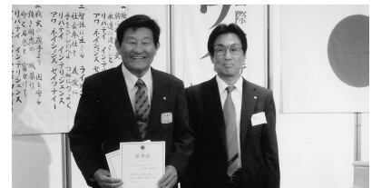
地区役員任命状伝達 (H21.7.16/7月第2例会)