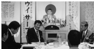
ビジター挨拶 (H21.7.16/7月第2例会)