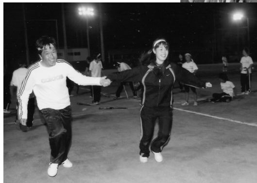
西高定時制運動会での一コマ (H21.9.16)