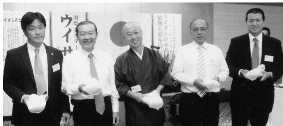
純出席100%目標例会において 出席ラッキー賞 (H21.10.15/10月第2例会)