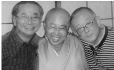
てかり三兄弟 忘年例会にて (H21.12.22/12月第2理事会)