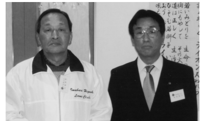
メンバーシップキー賞贈呈 (H22.1.7/1月第1例会)