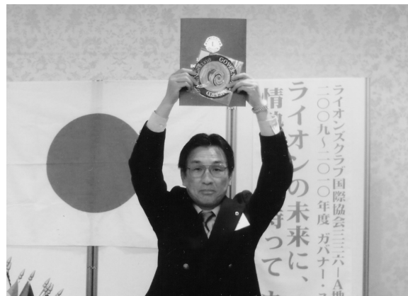
薬物乱用防止活動部門での特別賞(H22.4.15/4月第二例会)