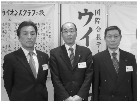
入会式(H22.4.1/4月第一例会)