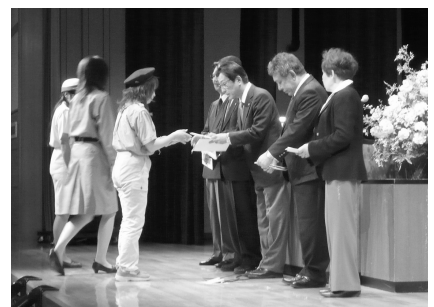
海洋少年団・ボーイスカウト・ガールスカウト合同入団式出席 (H22.5.16)