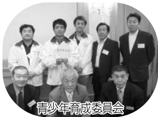
青少年育成委員会