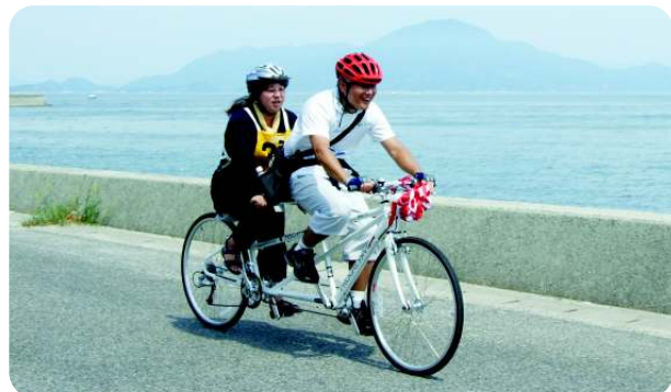
愛媛初! タンデム自転車しまなみを走る!!(H22.9.11)