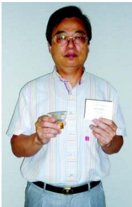
30回記念のカードとガラスの金杯