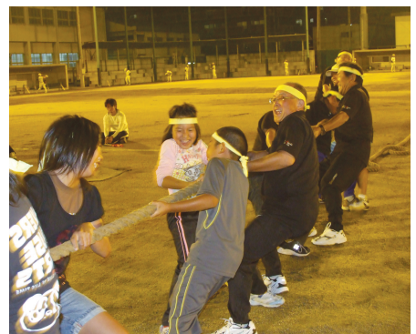
西高定時制運動会(H22.9.28)