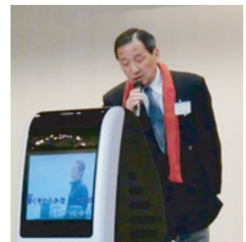
今治サーチングLC結成5周年記念式典 (H23.2.12)