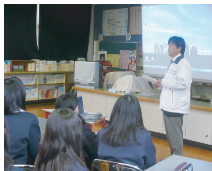
薬物乱用防止教室／城東小学校 (H23.2.10)