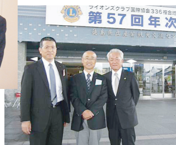
第57回年次大会(H23・5・22)