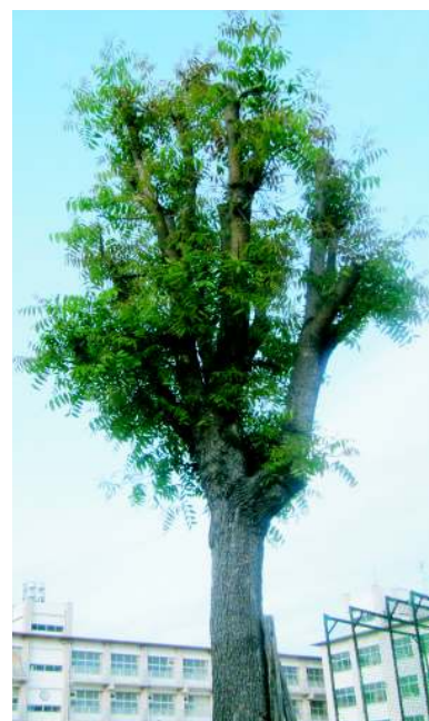
富田小学校に育つ楷の木 (平成23年5月22日撮影)

学名:とねりばはせの木 うるし科(PISTACIA CHINENSIS BUNGF) 通称:学問の木・孔子木・爛心木 樹高:約10年で4~5mに成長