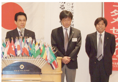
今年度7月第一例会にて(H22・7・1)