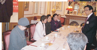
高知桜ライオンズクラブ例会訪問(H23・1・26)